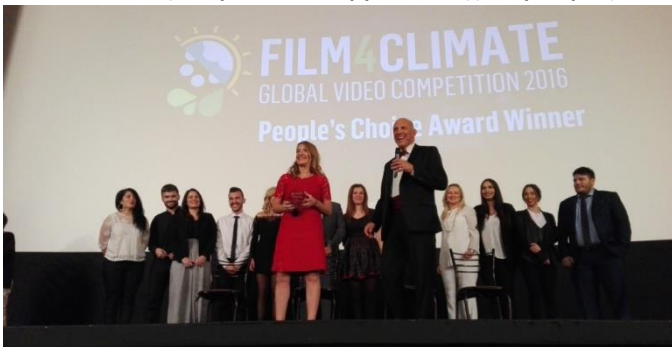
Από τη βράβευση της ομάδας ΣΚΥΡΟΣ 2016 κατά τη διάρκεια της Παγκόσμιας Διάσκεψης για την Κλιματική Αλλαγή (Μαρόκο)

Αλλαγή (COP22) στο Μαρακές του Μαρόκου (Νοέμβριος 2016).