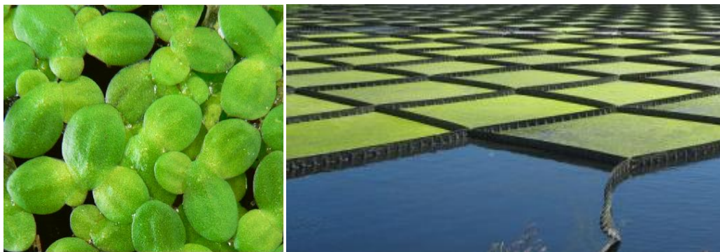
Εικόνα 1. Φωτογραφίες του υδροχαρούς φυτού Lemnaminor

Φυτά της οικογένειας Lemnaceae (κοινή ονομασία: duckweeds) συναντώνται στο περιβάλλον σε επιφανειακά ύδατα χαμηλής ροής και σε υγροτόπους. Τα συγκεκριμένα φυτά αναπτύσσονται συνήθως στην επιφάνεια του νερού, παρουσιάζουν μικρό μέγεθος (<5 mm μήκος) και μικρούς χρόνους διπλασιασμού (48-72 h). Στην περιβαλλοντική επιστήμη χρησιμοποιούνται ευρέως είτε για την εκτίμηση της τοξικότητας βαρέων μετάλλων και συνθετικών οργανικών ενώσεων 1 , είτε για την επεξεργασία των υγρών αποβλήτων σε συστήματα τεχνητών υγροτόπων 2 .