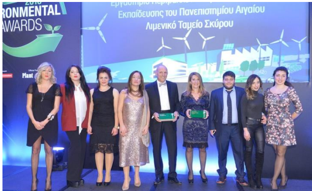
Εκπρόσωποι της πολυβραβευμένης -και χρυσής- ομάδας κατά την παραλαβή των βραβείων

αποτελέσαν δυο ακόμα κρίκους στην αλυσίδα της Αριστείας αυτής της συνεργασίας. Περιβαλλοντικές ενημερώσεις, Περιβαλλοντική κατασκήνωση, Τουριστικό και Θαλάσσιο Παρατηρητήριο, προβολές και εκδηλώσεις, Περιβαλλοντική φροντίδα κ.α αποτέλεσαν τον κορμό των δράσεων της πρακτικής άσκησης των φοιτητών του Τμήματός μας στο Λιμάνι της Σκύρου τα 2 τελευταία χρόνια, και συνεισέφεραν τα μέγιστα στην δημοφιλία και την εξωστρέφεια του Λιμένα που θεωρείται το πληρέστερο και πλέον φιλικό προς το περιβάλλον Δημόσιο Λιμάνι της Χώρας.